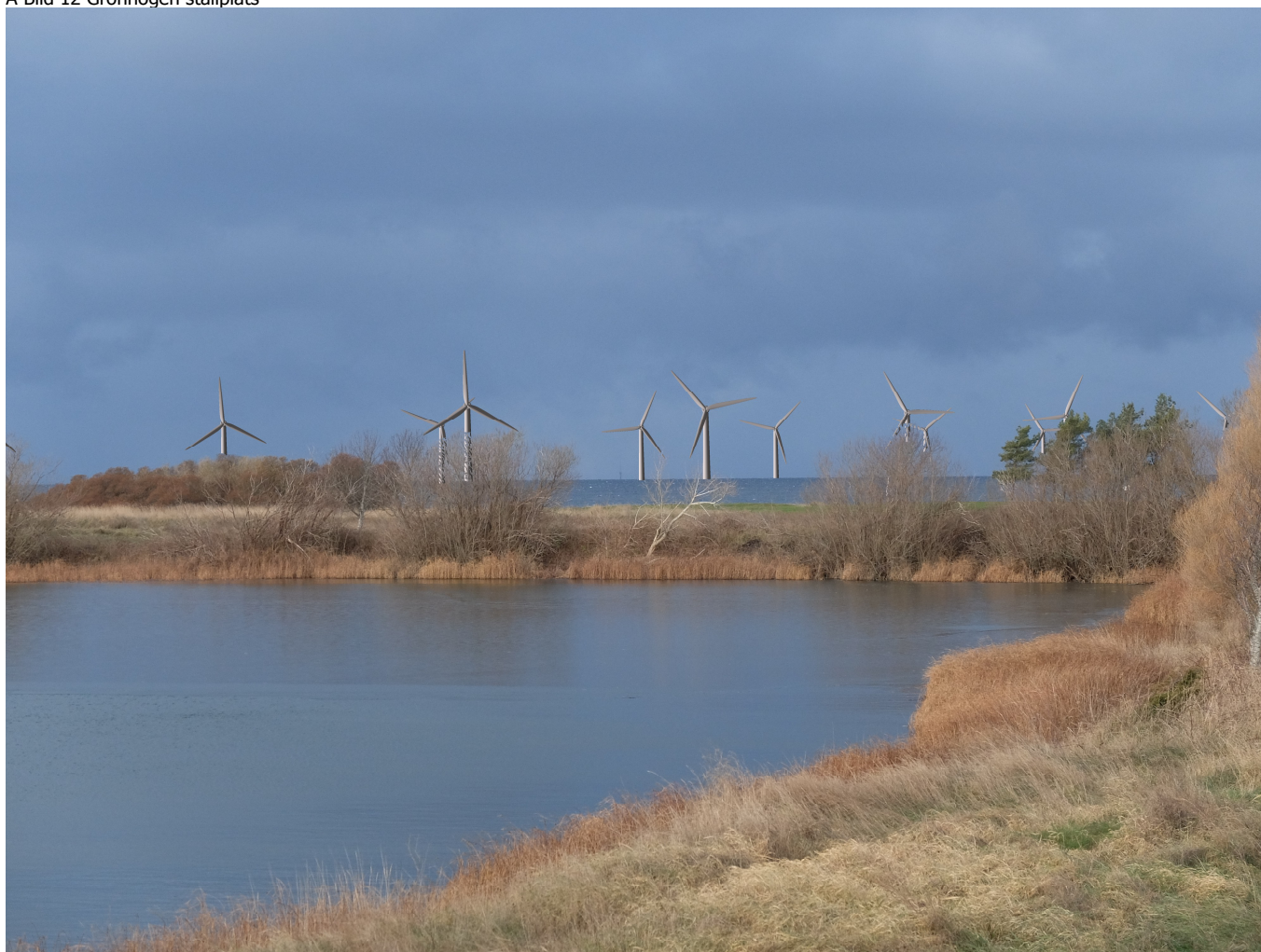
A Bild 12 Grönhögen ställplats

Swedish UTM 33-SWREF99 (SE) Ost Nord Z Moln :Klar himmel (0/8) Landskap bildfil: 4000 x 3000 pixels Siktpunkt 586 550 6 236 929 3,5 Synlighet :Mycket klar Mörbylånga 2021_273 Utgrunden Bild 12 Grönhögen ställplats.JPG Siktpunkt 580 030 6 245 223 -9,4 Sol :Rödaktig Synfält: 19,7°x13,3° Objektiv: 112 mm Film: 35x26 mm Foto kat. 323° Vind rikt. :0°